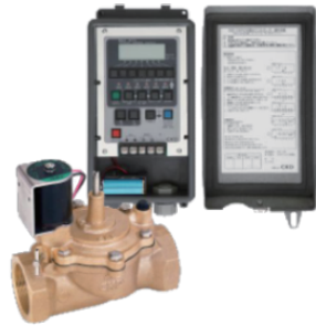
その他電磁弁 コントローラー