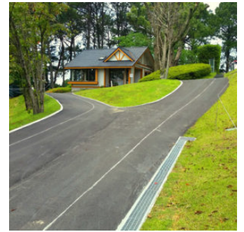
カート道関連商品