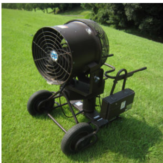
安全対策・環境機器