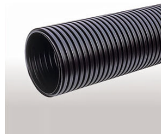
メンテナンス・土木資材