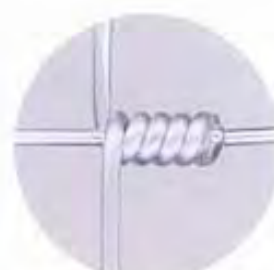
ヒンジロック結束状況