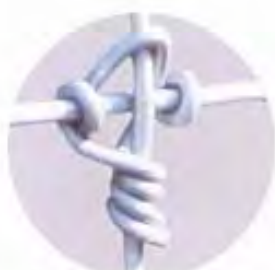
タイトクロス結束状況