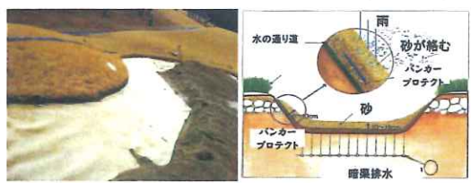
<バンカープロテクト施工例>

雨の度に、バンカー整備が・・・バンカーローンを施工すれば、この作業時間とバンカー砂のコストダウンが実現できます。